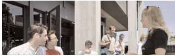
Law and Economics